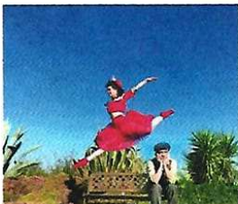
Un spectacle magique entre une danseuse et un magicien.

Un vagabond choisit un banc le temps d'une réflexion, le temps de se sentir de nouveau vivant. A travers l'imaginaire de ce personnage sincère et vulnérable, n'importe quel objet détérioré, sorti d'une poubelle, retrouve sens et beauté.